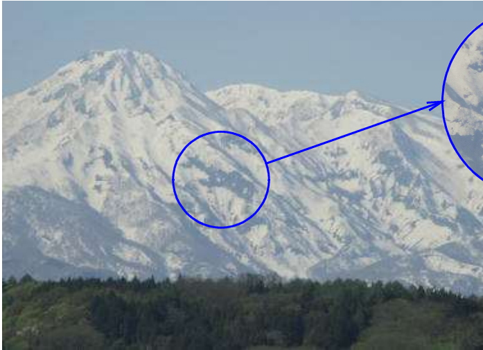
妙高山に現れた雪の残雪模様「跳ね馬」