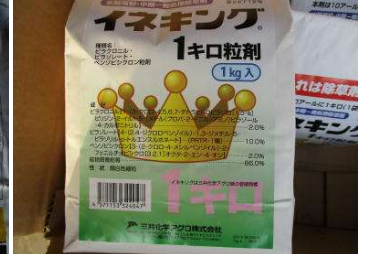
一回使用の除草剤