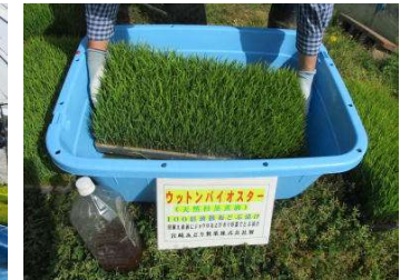
田植え直前にどぶ漬け